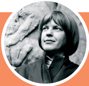
1926–1973 Ingeborg Bachmann

Ihr Roman Malina kommt 1991 nach einer Drehbuch-Vorlage von Elfriede Jelinek mit Isabelle Huppert in der Hauptrolle ins Kino. Das Leben der Dichterin wird zur Zeit vom Literaturmuseum der Österreichischen Nationalbibliothek im Rahmen einer Ausstellung beleuchtet.